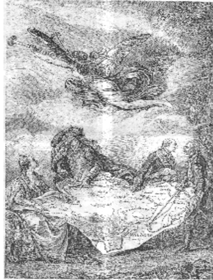
Н. Лямір. Тагачасная карыкатура на падзел Рэчы Паспалітай

планаў і намераў, выбар Гродна, які яшчэ з мінулых стагоддзяў з’яўляўся другой сталіцай Рэчы Паспалітай, здаваўся найлепшым. Стваралася ўражанне, што кароль пераехаў на